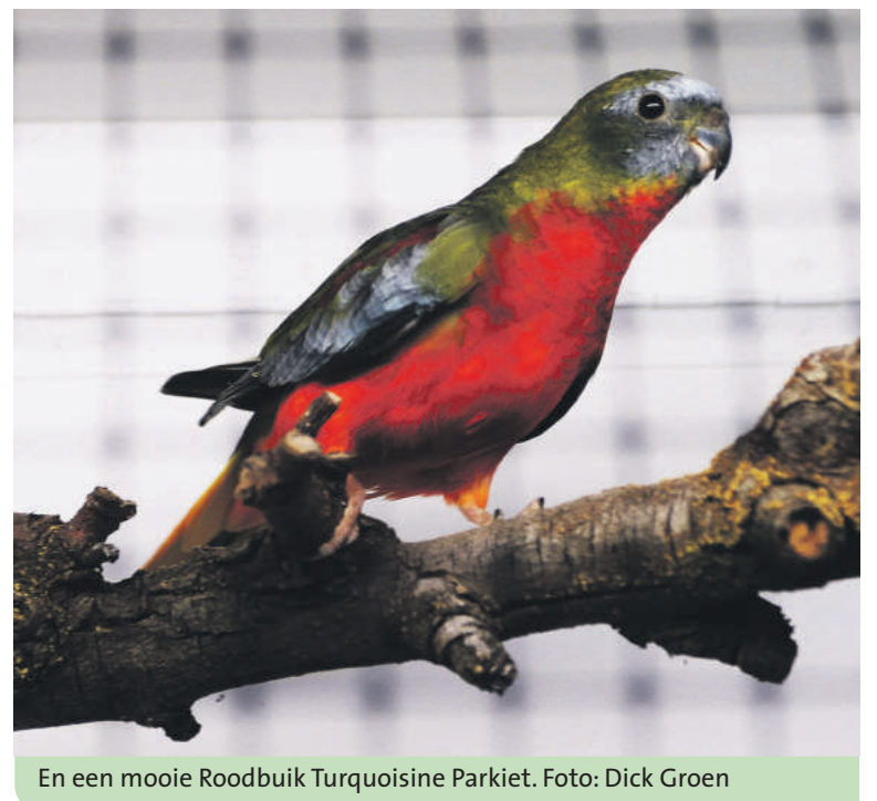
En een mooie Roodbuik Turquoise Parkiet.