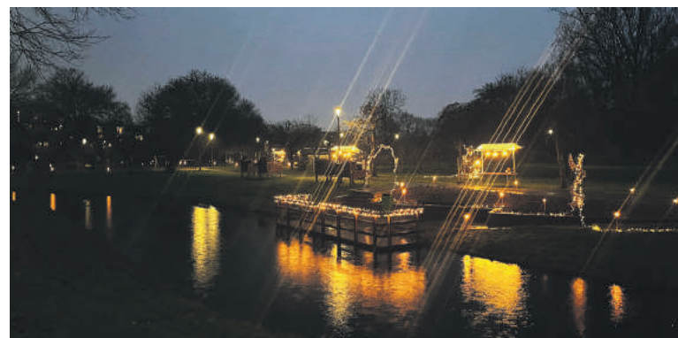
Sprookjesachtige lichtjes in Kokkebogaard.

"Let it snow, let it snow, let it snow" klonk het uit de monden van het Dickens-zangkoor in het prieeltje in Park de Kokkebogaard. Beter hadden die woorden kunnen zijn: "Let it rain, let it rain", want wat begon als een miezerbuitje veranderde in grotere druppels die vrij snel overgingen in echte en aanhoudende regen.