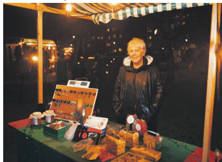
Kerstmarkt in Kokkebogaard.