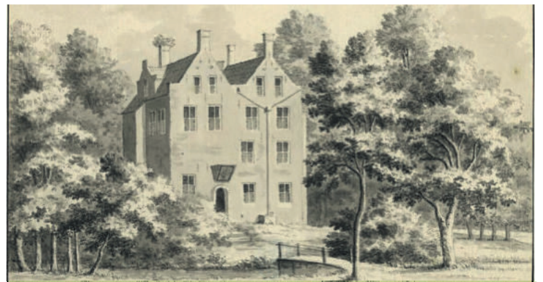
De ridderhofstad Vronenstein.