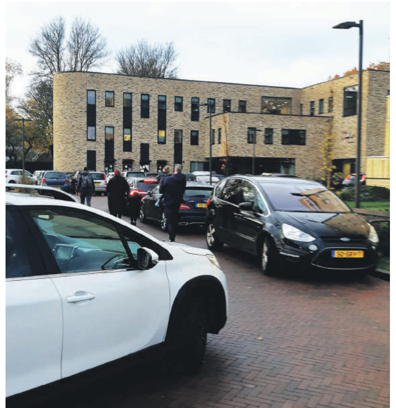
Complete chaos bij Gezondheidshuis de Componist. Mensen zetten elkaar vast en sommigen gaan gewoon op een invalidenplek staan.

Als het druk is zijn autobestuurders vooral gefocust op het vinden van een parkeerplek. Regelmatig scheelt het maar weinig of een andere auto loopt een deuk of kras op. Maar nog veel erger is dat ik daar zelf tot twee keer toe bijna van mijn fiets werd gereden, want fietsers moeten via het parkeerterrein naar de fietsenstalling rijden. En dan heb je ogen van achteren en van voren nodig. Ook de