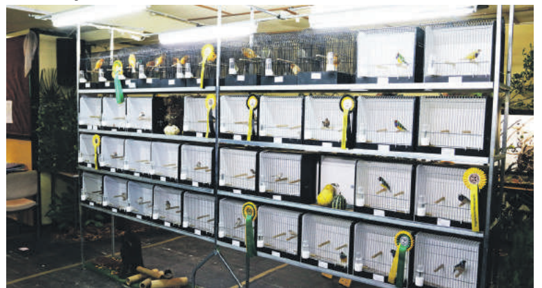
De volières met prijswinnaars.