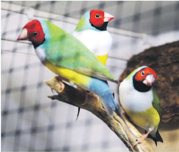
Drie prachtige kleurrijke Gould Amadines.