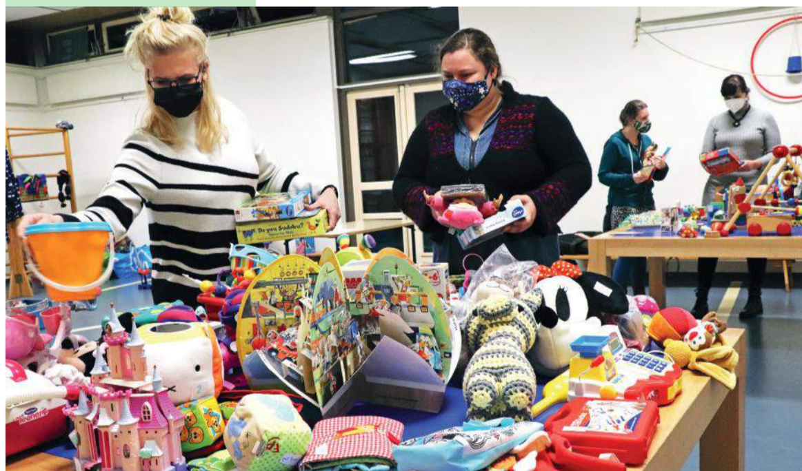
Foto onder: Een grote berg speelgoed, klaar voor een tweede leven.