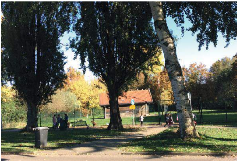
De Dierenweide in Park Kokkebogaard aan de Van Anrooylaan.