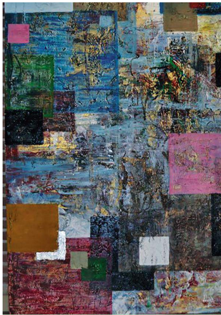
'Organized Chaos', een werk van Richard Westerhout.

gereisd, voor mijn werk. Mijn laatste reis was met mijn vriend in Italië, in Trentino wandelden we van 1200 naar 2800 meter hoogte van hut naar hut. Je komt dan zoveel mooie natuur tegen, ongelooflijk. We zijn allebei gek op lichten kijken, dat fascineert ons."