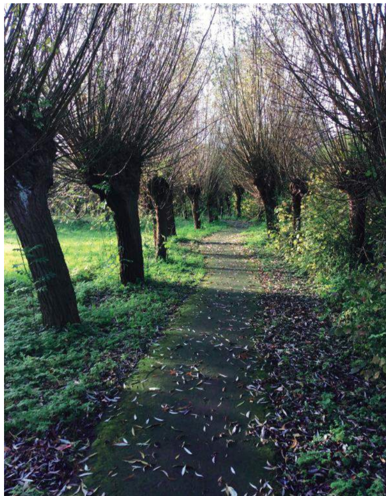
Het Kleeslaantje in Park Kokkebogaard.