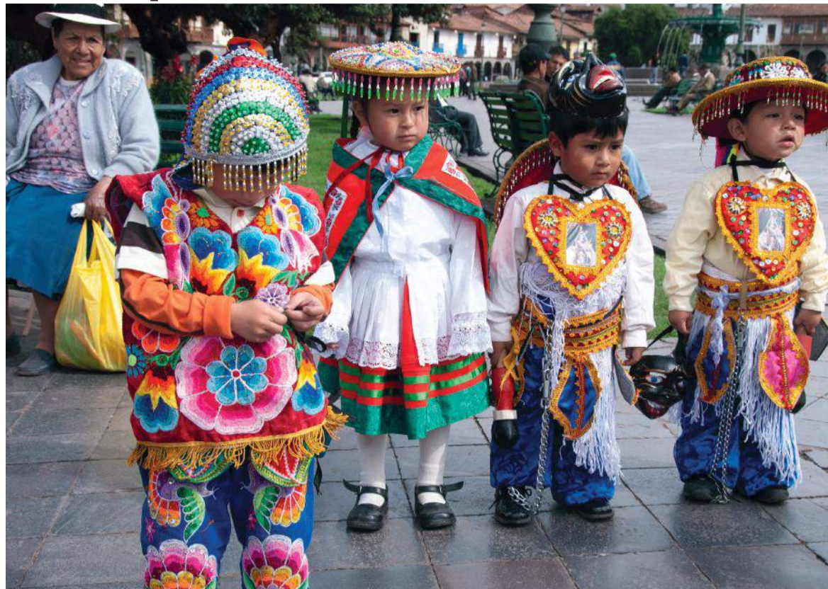
Foto boven: Vier kindjes in Colombia in hun prachtige kleurrijke kleding.