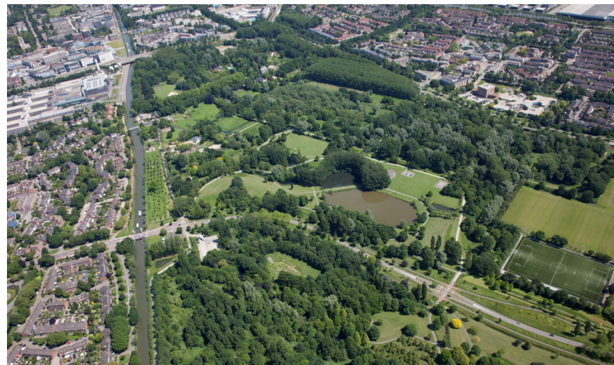
Luchtfoto 6 juni 2014

Er is ook parkeeroverlast in het park als er voetbal wedstrijden zijn op het sportcomplex Parkhout dat in de zuid-oosthoek van het Park Oudegein ligt.