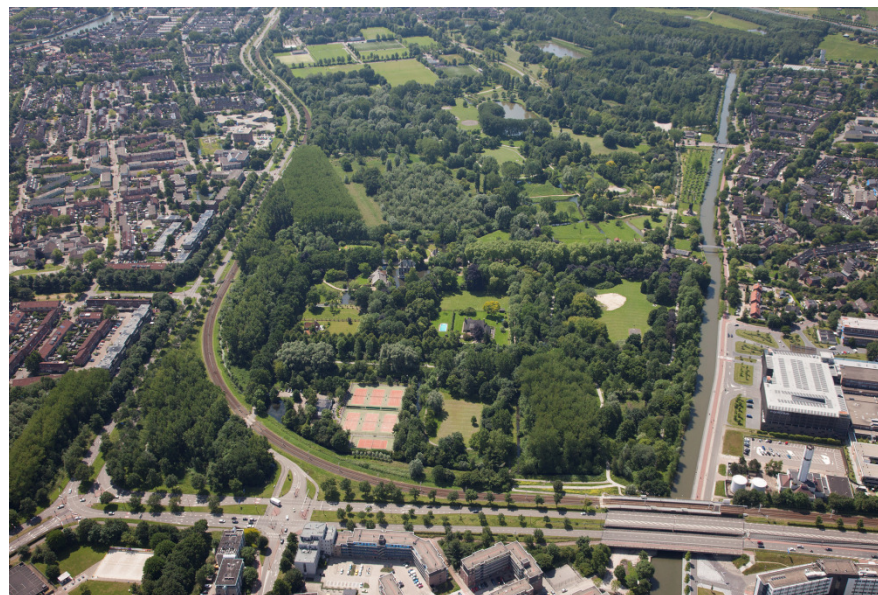
Luchtfoto 6 juni 2014

De noordelijke entree nabij het viaduct wordt niet veel gebruikt door bezoekers van het park. Er is geen aanleiding in het park om deze entree te nemen. Ook is het niet zichtbaar wat er te doen is en het wordt als niet sociaal veilig ervaren. Het is daardoor bij veel mensen een onbekende entree naar het park.