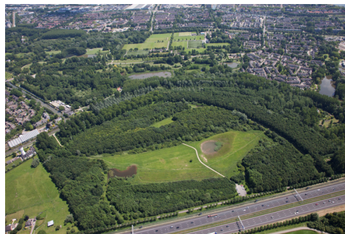
Luchtfoto 6 juni 2014

Hoge Landen bestaat uit bos met in het middengebied een open ruimte van nat grasland waarin zich twee poelen bevinden. Het wordt gebruikt door wandelaars en het hele gebied is losloopgebied voor honden.