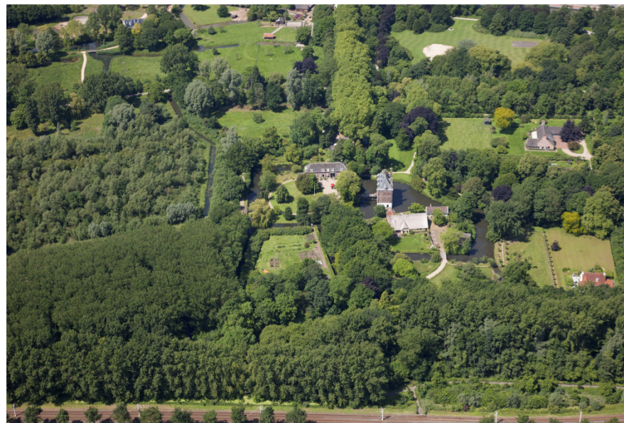
Luchtfoto 6 juni 2014

waarde. Het gebied waar het oude klooster in ligt is nu een ontoegankelijk bosgebied en is ecologisch interessant.