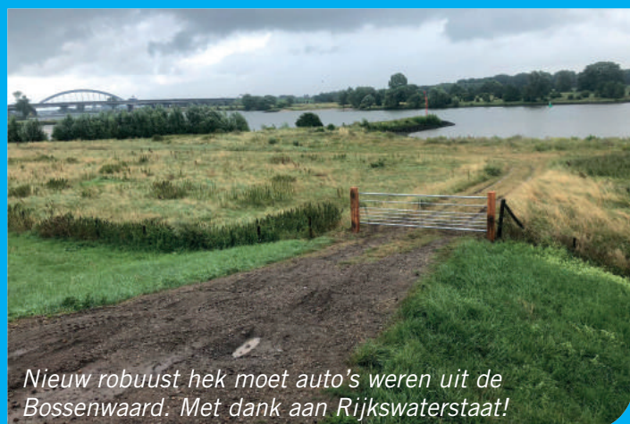
Nieuw robuust hek moet auto's weren uit de Bossenwaard. Met dank aan Rijkswaterstaat!