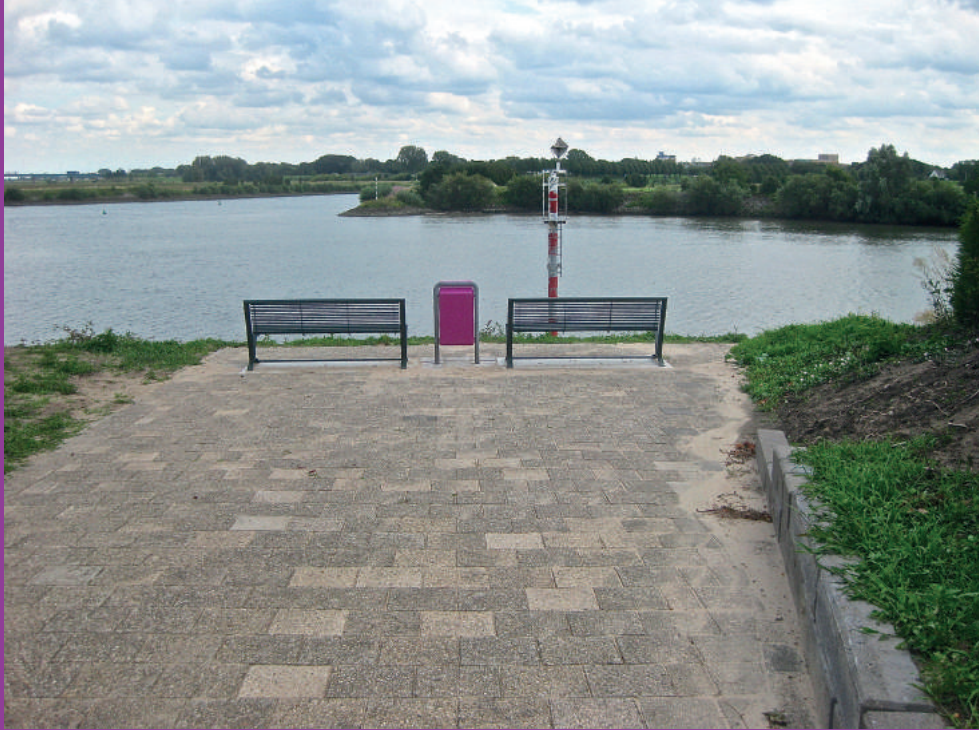
Het vernieuwde uitzichtpunt Ankermonde