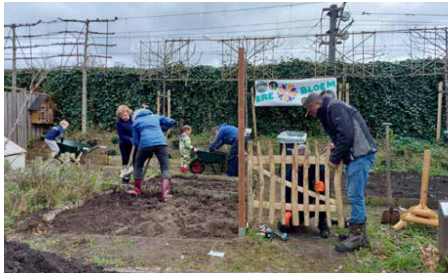
NLDoet - Pluktuin EreBloem