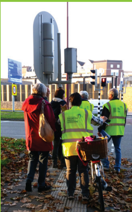
Het wijkplatform viel op tijdens de wijkschouw in het straatbeeld

Op 2 en 3 november heeft de wijkschouw plaatsgevonden. Leden van het wijkplatform hadden een route samengesteld die leidde langs een aantal locaties waar verbeteringen wenselijk waren. Van de gemeente waren hierbij de wijkmanager, de afdeling Beheer en een verkeersdeskundige betrokken. Op een aantal locaties werd met omwonenden gesproken. Het verslag van de wijkschouw zal op de website worden geplaatst, www.wijkplatformhzi.nl