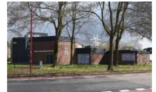
L. de Emmauskerk, r. de Bron