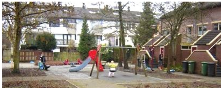
Gaat uw woon- en leefomgeving ook u aan het hart?