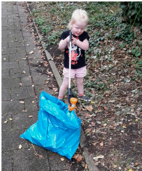
"Jong geleerd, oud gedaan"

Sinds een aantal jaren lopen een bewoner en een aantal cliënten van Lister iedere woensdagmiddag een uurtje het zwerfafval op te ruimen in de Rijtuigenbuurt. In het begin werd er bij alle weersomstandigheden gelopen maar het laatste jaar lopen we als het weer dit toelaat. Dus niet bij extreme hitte en niet bij hoosbuien.