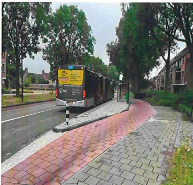
Voorbeeld eindsituatie Bushalte

In 2021 is het Mobiliteitsprogramma Nieuwegein 2021 – 2030 door de gemeenteraad vastgesteld. Eén van de maatregelen die hierin opgenomen zijn is het halteren van de bus op de rijbaan. Hierdoor wordt het veiliger voor de fietsers, men hoeft de bus niet meer te passeren en op de bus te wachten. Verder bespaart het tijd voor de bussen.